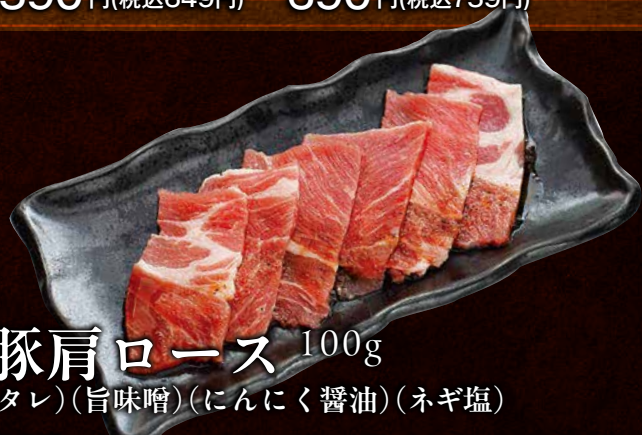
豚肩ロース 100g (タレ)(旨味噌)(にんにく醤油)(ネギ塩) 590 円(税込649円)