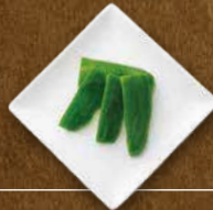
ピーマン 290 円(税込319円)