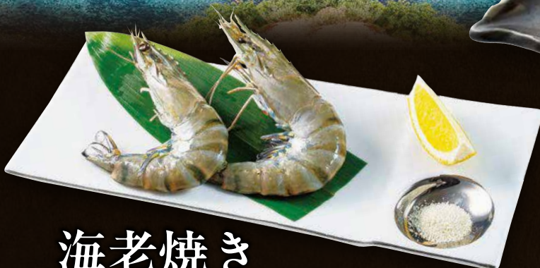
海老焼き 690 円(税込759円)