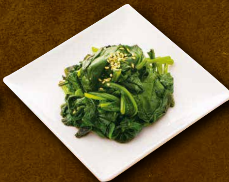
ナムル ほうれん草