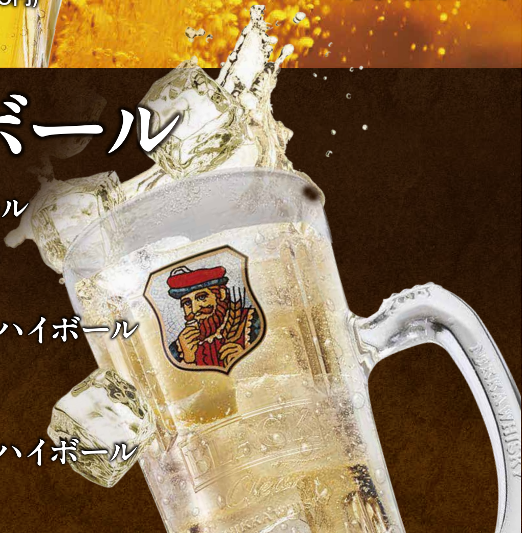
シーバス ミズナラ12年 ハイボール ALC. 約8% 780 円(税込858円)