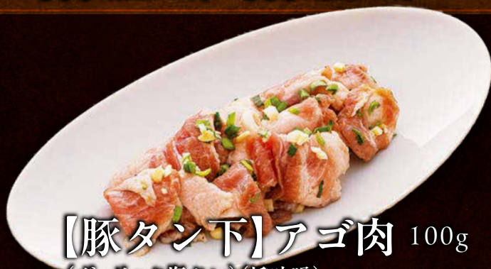
【豚タン下】アゴ肉 100g (ガーリック塩タレ)(旨味噌) 590 円(税込649円)