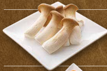
エリンギ 290 円(税込319円)