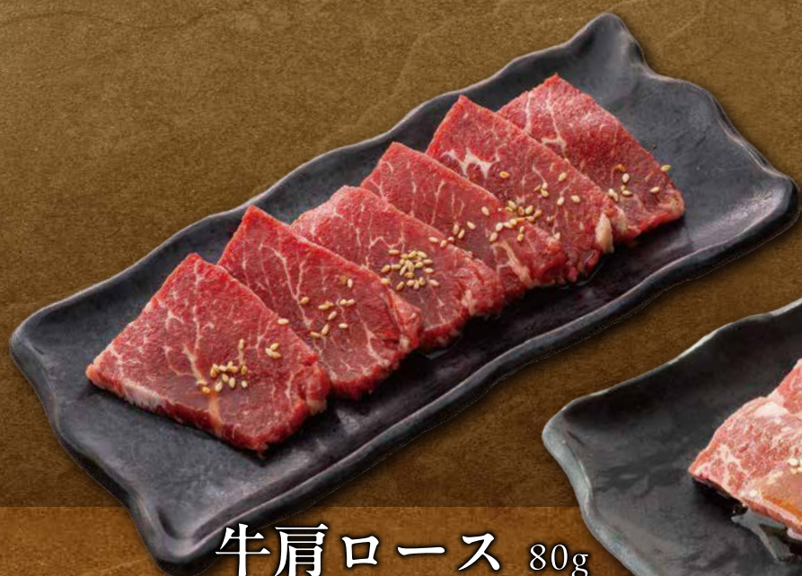
牛肩ロース 80g (タレ) (にんにく醤油) 690 円(税込759 円) (ネギ塩) 790 円(税込869 円)