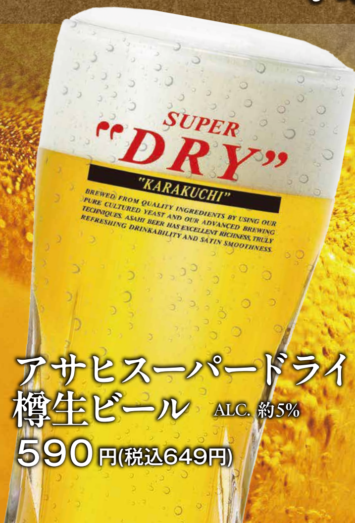
アサヒスーパードライ 樽生ビール ALC. 約5% 590 円(税込649円)