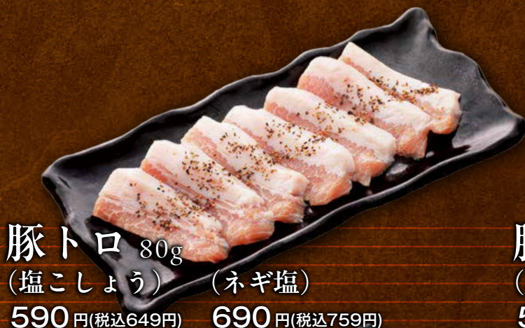
豚トロ 80g (塩こしょう) (ネギ塩) 590 円(税込649円) 690 円(税込759円)