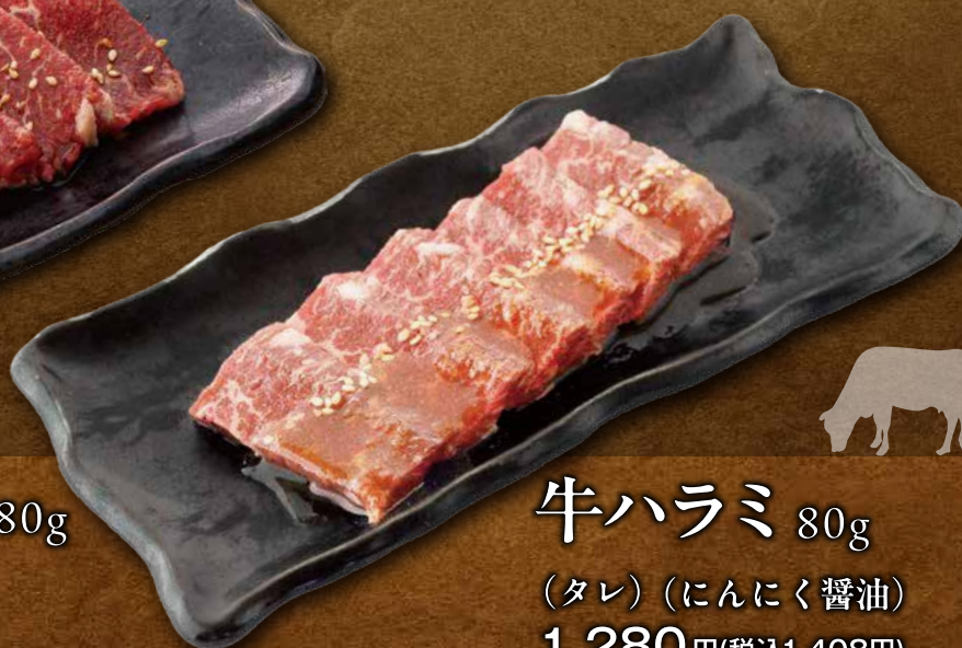
牛ハラミ 80g (タレ) (にんにく醤油) 1,280 円(税込1,408 円) (ネギ塩) 1,380 円(税込1,518 円)