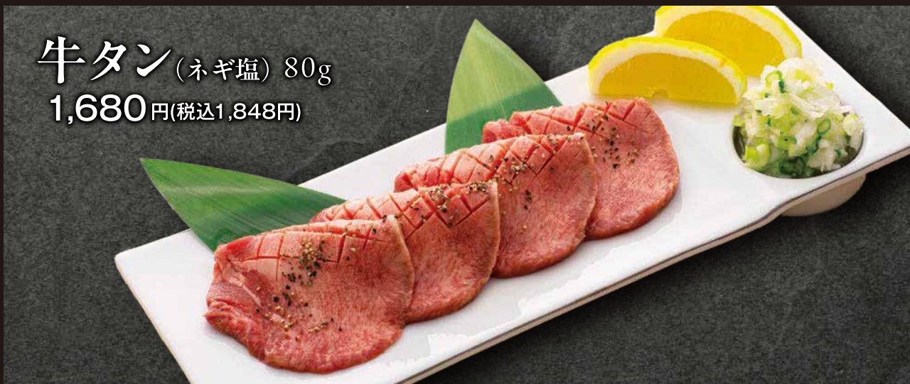
牛タン (ネギ塩) 80g 1,680 円(税込1,848 円)