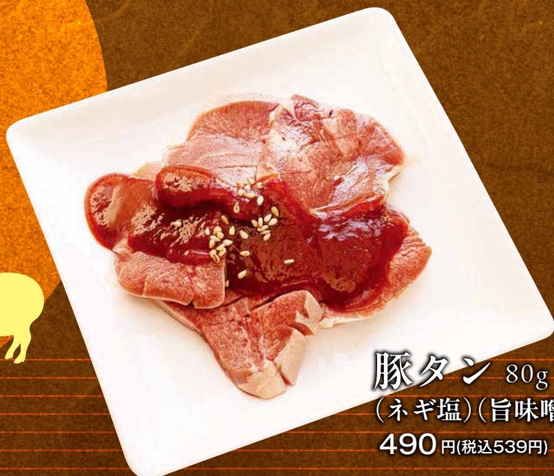
豚タン 80g (ネギ塩)(旨味噌) 490 円(税込539円)