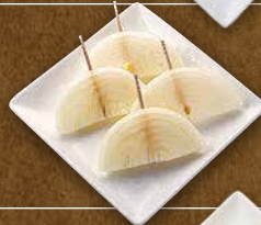
玉ねぎ 290 円(税込319円)