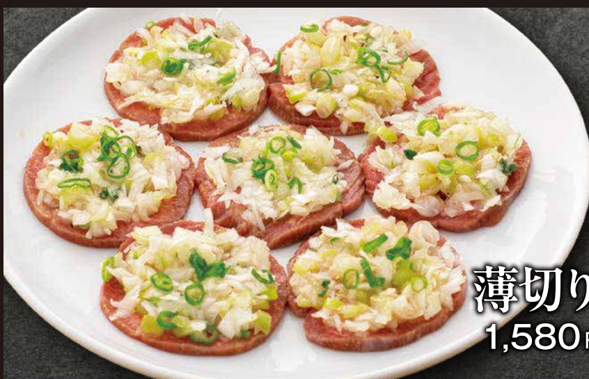
薄切り牛タン (ネギ塩) 70g 1,580 円(税込1,738 円)