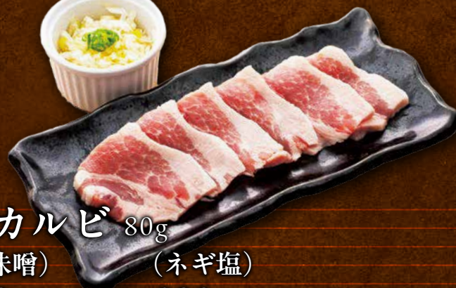
豚カルビ 80g (旨味噌) (ネギ塩) 590 円(税込649円) 690 円(税込759円)