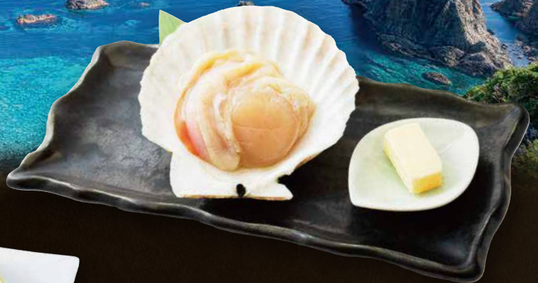
ホタテ焼き 490 円(税込539円)