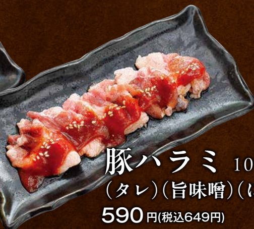
豚ハラミ 100g (タレ)(旨味噌)(にんにく醤油) 590 円(税込649円)