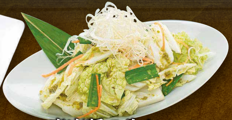
青唐醬の生キムチ