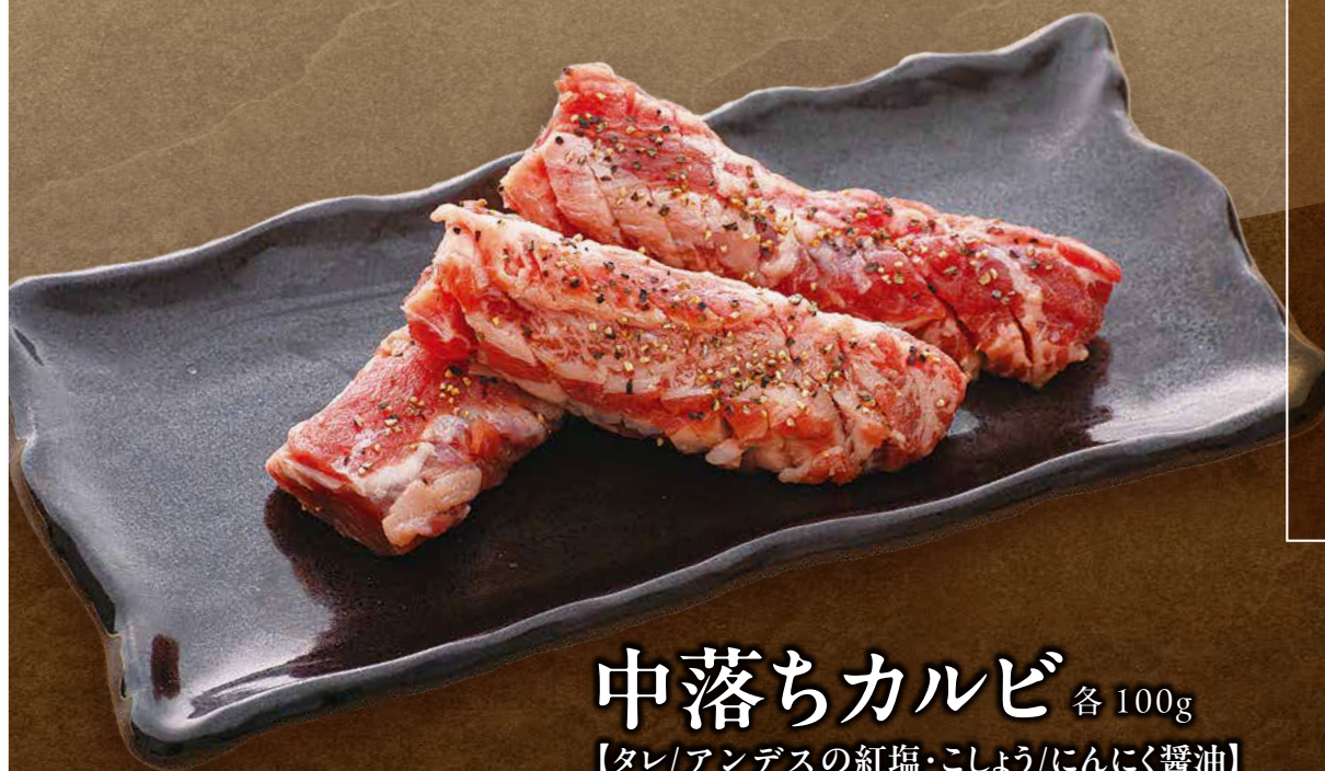
中落ちカルビ 各 100g 【タレ/アンデスの紅塩・こしょう/にんにく醤油】 890円 (979円 税込)