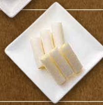
長ねぎ 290 円(税込319円)